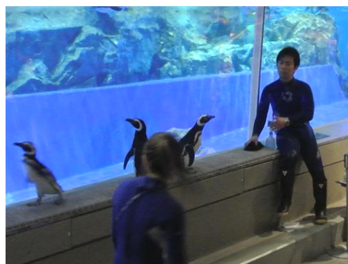
いつも泳いでいる水槽をのぞき込むペンギンたち