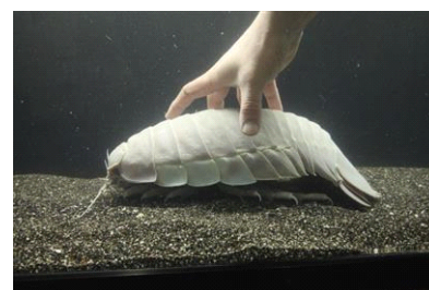
ダイオウグソクムシ

開催内容：オウムガイやカブトガニなど、古代よりあまり姿が変わっていない水生生物の展示を行います。