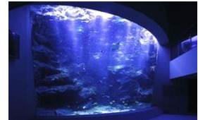
小笠原の海を再現した「東京大水槽」