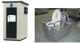
世界自然遺産・小笠原諸島へ寄贈するバイオトイレ