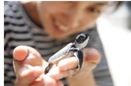
【初公開】小笠原生まれのアオウミガメの赤ちゃん