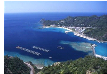
「世界自然遺産・小笠原諸島」

プログラム名：「小笠原の自然を守る授業」 開催日：2014年11月8日(土)、11月15日(土) 開催時間：①13時00分～13時35分 ②15時00分～15時35分 開催場所：5階 特設スペース 参加方法：当日申し込み 参加定員：各回20名 参加対象：小学1年生～3年生 開催内容：第1限「うんちとトイレのおはなし」(小林製薬) 第2限「トイレが守る小笠原の自然」(小笠原村観光局)