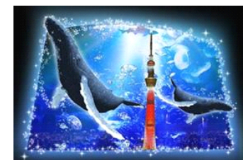
「小笠原から実物大クジラがやってきた!」

展示名：大水槽プロジェクションマッピング 『小笠原から実物大クジラがやってきた!』 上映期間：2014年11月5日(水)～2015年1月12日(月・祝) 上映時間：各日10時00分～20時30分 ※毎時00分と30分に各回約5分間 投影 上映場所：「東京大水槽」 上映内容：世界自然遺産・小笠原諸島の海を再現した高さ6メートル幅9メートルの「東京大水槽」で、体重30トン・全長15メートルの小笠原のザトウクジラが、プロジェクションマッピングで再現されます。