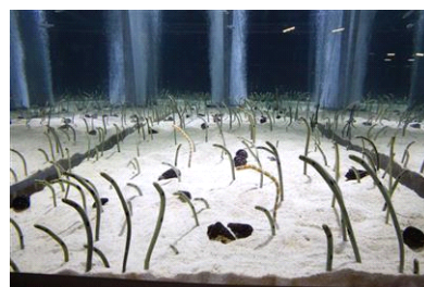
二人が愛を誓うチンアナゴ水槽