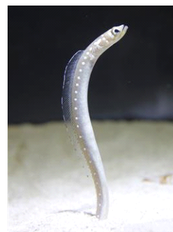
ホワイトスポッテッドガーデンイール

生 物 名：ホワイトスポッテッドガーデンイール 展示期間：2014年10月10日(金)～常時展示 展示場所：チンアナゴ水槽 生物紹介：東南アジアからインド洋にかけて分布し、サンゴ礁の細かい砂地に巣穴を掘り、群れを作ります。体は茶褐色で、側面に均等に白い点が並んでいます。エラ付近の大きな白い斑点が特徴。最大体長は約70cm。