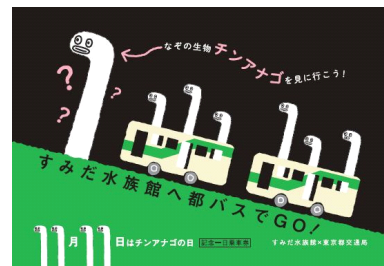
チンアナゴデザイン之都バス一日乗車券