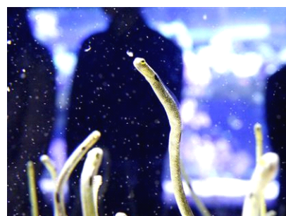
チンアナゴの「さあ、ゴハン！」

タイトル：なぞのせいぶつ？ゆらゆらチンアナゴ 開催期間：2014年10月10日(金)～11月30日(日)※11月11日(火)は除く 開催時間：各日18時45分～19時30分 開催場所：6階 チンアナゴ水槽前 参加定員：各回20名 参加対象：3歳以上 ※小学生未満は保護者同伴 参加料金：無料 参加方法：当日17時30分より館内インフォメーションで申し込み 内 容：謎の多いいきもの・チンアナゴを飼育スタッフと一緒に観察します。観察後はオリジナルのチンアナゴフィギュアを作ります。