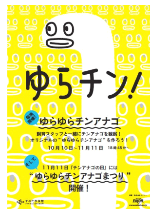
ゆらゆらチンアナゴまつり