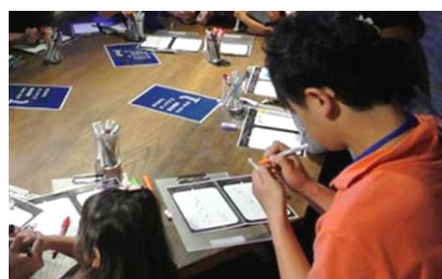
なぞのせいぶつ？ゆらゆらチンアナゴ

タイトル：なぞをときあかせ！チンアナゴ検定 開催期間：2014年11月1日(土)～11月30日(日) 開催時間：終日開催 開催場所：6階 チンアナゴ水槽付近 参加方法：当日受け付け 参加対象：小学生以上 参加料金：無料 開催内容：チンアナゴ博士を目指して検定にチャレンジ！チンアナゴ、ニシキアナゴ、ホワイトスポッテッドガーデンイール、マアナゴをよく観察すると答えが分かります。