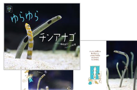
写真絵本「ゆらゆらチンアナゴ」

タイトル：ゆらゆらチンアナゴ 出 版 社：ほるぷ出版 発 売 日：2014年11月初旬 著 者：(写真)横塚 眞己人、(文)江口 絵理 販売価格：1,300円(税抜き) 体 裁：32ページ・オールカラー ※この絵本の90%の写真は、すみだ水族館で撮影されました。