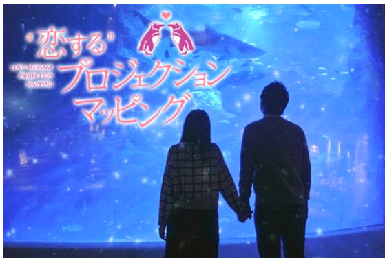
『恋する投影マッピング』 ※イメージ