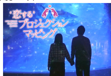
『恋するプロジェクションマッピング』 ※イメージ

イベント：『恋するプロジェクションマッピング』 開催期間：2014年12月20日(土)～12月25日(木) 開催時間：①各日18時30分～18時40分(約10分間) ②各日19時30分～19時40分(約10分間) 募集人数：各回20名(20メッセージ)※応募者多数の場合は抽選 募集内容：「大切な人に伝えたいありがとうのメッセージ」 「大切な人に伝えたい愛のメッセージ」など 上映する100字以内のメッセージ(宛名・タイトル含む) 参加料金：無料 ※入場料別途 募集期間：2014年12月9日(火)～12月15日(月) 応募方法：①すみだ水族館 公式ホームページ ( http://www.sumida-aquarium.com ) ②ツイッターで応募用ハッシュタグ 「#恋するすみだ水族館」を付けて投稿 ( https://twitter.com ) 開催内容：高さ6メートル、幅9メートルの「東京大水槽」に 皆さまから募集したメッセージを、プロジェク ションマッピングで上映します。