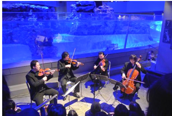
ペンギン水槽前で演奏する 新日本フィルハーモニー交響楽団