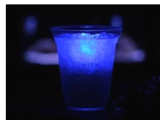
『ブルーナイトカクテル』

商品名：『ブルーナイトカクテル』 販売価格：620 円 (税込み) ※ノンアルコールは 500 円 (税込み) 販売期間：2015 年 1 月 12 日 (月・祝) まで販売 販売時間：18 時 00 分～21 時 00 分 販売場所：5 階 ペンギンカフェ 商品内容：青く光る LED の入った氷型キューブが浮かぶ柑橘リキュールのカクテルです。 カクテルを片手に夜の演奏会をお楽しみください。