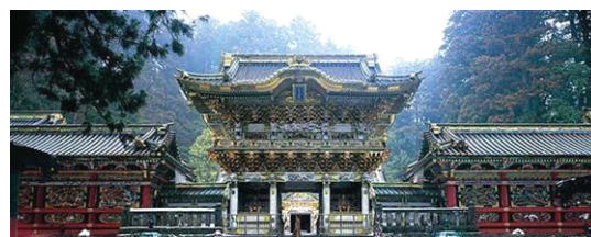
日光東照宮 / 栃木県