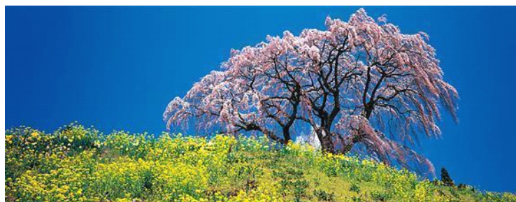
三春の桜 / 福島県

自然の一木一草に至るまで精彩に描写された写真からは、その環境に生息している多様な生きものたちの息吹まで感じられ、美しく懐かしいニッポンが目の前に鮮やかに広がります。