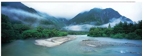
上高地・梓川 / 長野県