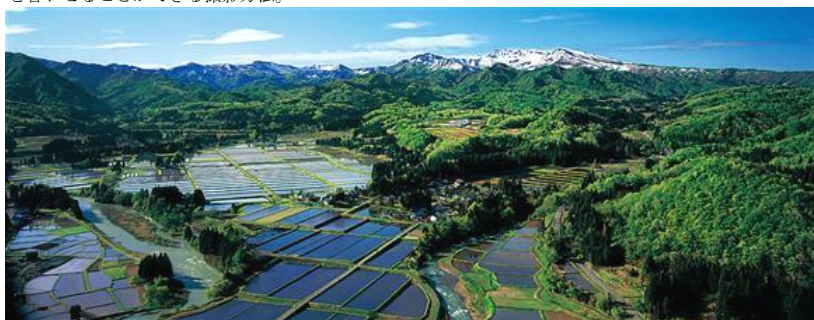
高さ 1.5メートル×幅 4メートルのサイズで展示する作品「八木鼻からの眺望」（新潟県）

※蛇腹でつながったレンズ部とフィルム部を自由に動かせる大判カメラの特徴を活かし、被写体のピント面の調整をすることで、被写体全面にピントを合わせることができる撮影方法。