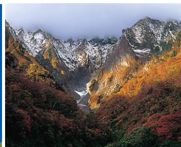
谷川岳 / 群馬県