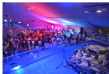
ペンギンプールの前で行う アーティストによるライブ

③飼育スタッフによるトークライブ「ペンギンライブ」 飼育スタッフだからこそわかるペンギンたちの個性や、さまざまな恋愛模様について解説します。