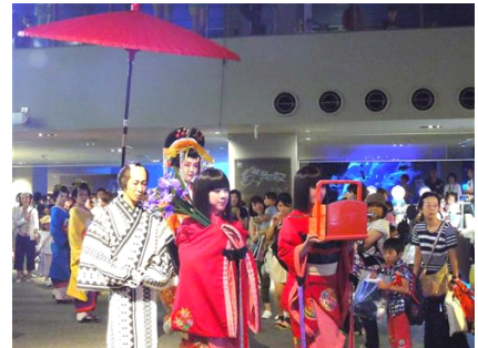
「江戸ワンダーリウム」開催風景

第1弾の「江戸ワンダーリウム」では、7月31日(金)から8月2日(日)までの3日間、『すみだ水族館』内の江戸をテーマにしたゾーン「江戸リウム」を中心に、忍者による殺陣とともに子供たちが殺陣体験を楽しめる「忍者ショー」や、艶やかに着飾った花魁が館内を練り歩く「花魁道中」などを開催しました。まるで江戸時代にタイムスリップしたかのような『すみだ水族館』で、『江戸ワンダーランド 日光江戸村』からやってきた「江戸人」と来場されたお客さまと一緒に楽しく盛り上がりました。