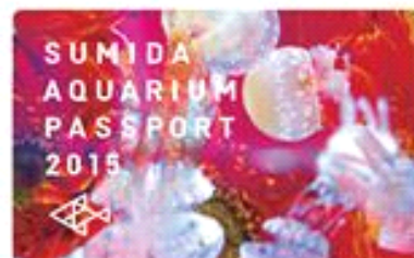
オリジナル年間パスポートデザイン

販売期間：2015年9月9日（水）～12月27日（日） ※販売枚数に達しますと、期間中でも終了させていただきます。 販売時間：9時00分～20時00分 販売場所：年間パスポート窓口 デザイン：1種類 販売内容：『すみだ水族館』の年間パスポートは、通常の2回分の入場料で、1年間に何回でもご入場いただけるお得なパスポートです。期間限定で、特別デザインの年間パスポートを販売します。