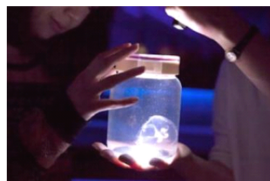
「ふわふわクラゲガール」

「ふわふわクラゲガール」は、夜の水族館でクラゲをじっくりと観察するプログラムです。毎週金曜日の夜に女性限定で行いますので、一週間の仕事が終わった後、ふわふわ漂うクラゲに癒されてみてはいかがでしょうか。