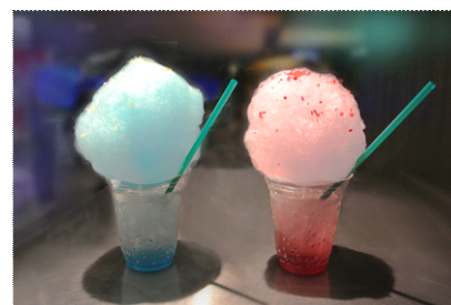
(右)ふわふわクラゲソーダ 昼

開催内容：ふわふわしたクラゲをイメージしたわたあめが乗った、ピーチ味のゼリー入りのソーダです。『蛭川実花×すみだ水族館 クラゲ万華鏡トンネル』の昼バージョンと夜バージョンのそれぞれをイメージしたカラーでお楽しみいただけます。また、大人向けとしてアルコール入りも販売します。