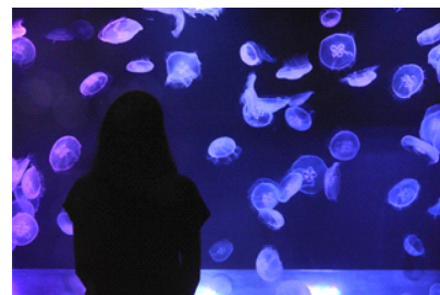
「秋を楽しむ。ミズクラゲ水槽」

タイトル：秋を楽しむ。ミズクラゲ水槽 展示期間：2015年9月24日(木)～9月30日(水) 展示時間：終日開催 展示場所：クラゲゾーン ミズクラゲ水槽 展示内容：9月27日(日)の「中秋の名月」に合わせ、ミズクラゲの水槽を、海の中に届く月の光をイメージしたブルーやパープルにライティングします。幻想的な光の中で泳ぐミズクラゲを見ながら、心地よい秋の訪れを感じてみてください。