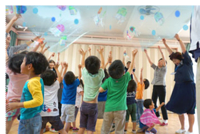
「クラゲとザブーン」

開催内容：クラゲのモビールをつけた大きな布をみんなで一緒に持ち上げて、クラゲたちが漂う大きな波や小さな波を作るプログラムです。思いっきり体を動かして遊びましょう。