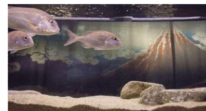
葛飾北斎の浮世絵とマダイ