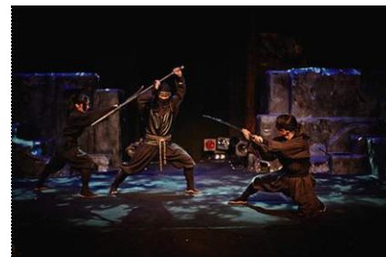
「忍者ショー」イメージ