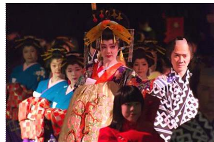
「花魁道中」イメージ