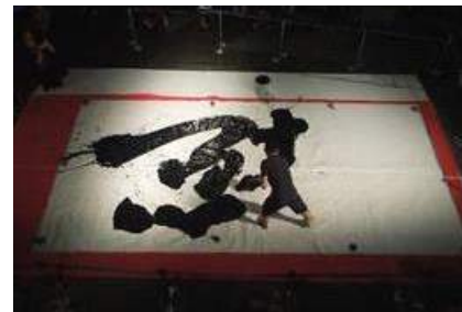
昨年の書道パフォーマンスの様子