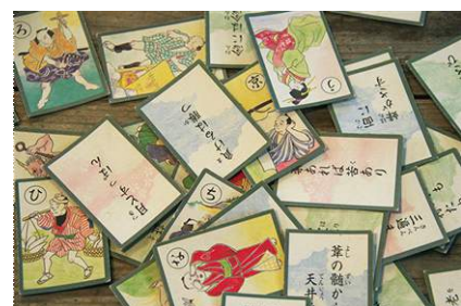
「お江戸のお正月遊び」イメージ

開催内容：江戸村ワンダーランドからやってきた「江戸人」たちと一緒に『おさかな福笑い』や『コマ回し』などの伝統的なお正月遊びを楽しめます。