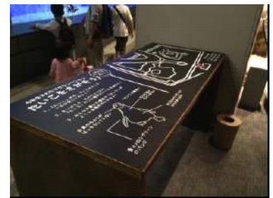
「「ふうりん」ワッチ」イメージ