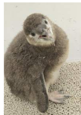
現在の「ふうりん」(2016年8月2日時点)

名 前：ふうりん 産卵日：2016年5月7日(土) 孵化日：2016年6月16日(木) 両 親：ローズ(♂)、わらび(♀) 体 重：8月2日(火)(生後47日)時点で2,574g (孵化時点/100g) 体 長：8月2日(火)(生後47日)時点で40cm (孵化時点/12cm) 性 別：10月ごろに検査予定