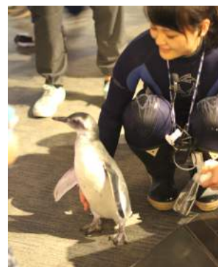
バックヤードから歩いてプールまで向かう様子(昨年)

開 催 期 間：2016年8月28日(日)～9月2日(金) 開 催 時 間：各日10時50分～ (10分～20分程度) 開 催 内 容：「ふうりん」は引き続きペンギンプールに慣れるために遊泳練習を行います。仕切りのあるペンギンプールの中でたどたどしくも可愛らしく泳ぎます。