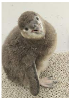
「ふうりん」(2016年8月2日時点)