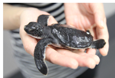
アオウミガメの赤ちゃん

『すみだ水族館』は、2012年より、毎年小笠原諸島で生まれたアオウミガメの赤ちゃんを預かり、約1年間育てて小笠原諸島の海へ放流する活動を続けてきました。今年は、小笠原で生まれたアオウミガメの赤ちゃんと、名古屋港水族館で生まれたアカウミガメの赤ちゃんの2種を比較しながら観察いただける企画展を開催しています。