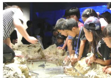
ウミガメの観察風景

開催日：9月17日(土)～9月22日(木・祝) 開催時間：各日終日 ※ワークシートがなくなり次第、終了とさせていただきます。 参加方法：館内設置のワークシートを使用して、ご自由に参加いただけます。 開催内容：ウミガメをじっくり観察しながらワークシートの設問に答え、生態について楽しく学ぶプログラムです。