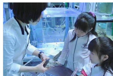
「ウミガメ研究員」開催の様子

開催日：9月17日(土)・9月18日(日) 開催時間：各日11時00分～12時00分 募集対象：小学校3年生～6年生 募集定員：1回につき、最大6名 参加方法：すみだ水族館ホームページから事前申し込みが必要です。 応募者多数の場合は抽選となります。 開催内容：飼育スタッフと同じ白衣を着てウミガメについて研究するプログラムです。ウミガメをより身近に感じることができます。