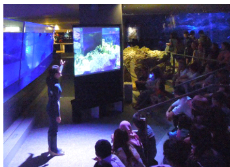
ペンギンライブ イメージ

開催日：2017年1月28日(土)～1月31日(火) 開催時間：各日18時00分～18時10分 開催場所：5F ペンギンプール前 開催内容：飼育スタッフが、ペンギンカップルの絆についてお話します。愛のあふれるペンギンたちの話には、共感することや見習いたいと思うことがきっとあります。夫婦円満の秘訣(ひけつ)も見つかるかもしれません。