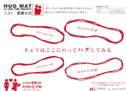
日本愛妻家協会×日比谷花壇 特製ハグマット

足型にあわせて夫婦で立っていただき、ハグすることにより夫婦間のコミュニケーションを深めていただく簡易グッズ（紙製マット）です。「愛妻の日」1月31日の午後8(ハ)時9(グ)分に、全国のご夫婦が一斉にハグをして世の中を一瞬明るくするためにお使いいただけます。