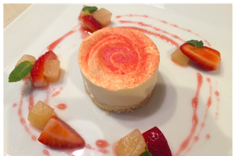
ローズティラミス イメージ

販売期間：2017年1月28日(土)～3月14日(火) 販売時間：9時00分～21時00分 ※各日限定10食 販売価格：800円(税込) 販売場所：5F ペンギンカフェ 商品内容：日比谷花壇の花を感じるスイーツ「ヒビヤカダンスイーツ」で使用されている香り高い希少な食用バラ「さ姫」のローズシロップを使い、皿の上に咲く一輪のバラをイメージして作ったティラミスです。女性の心をくすぐる、見た目も華麗な一皿となりました。