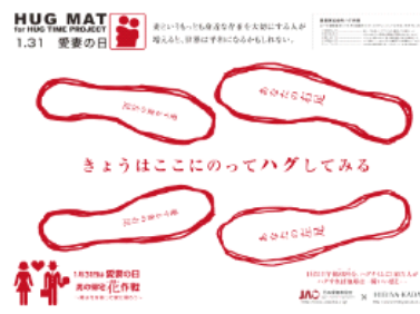
日本愛妻家協会×日比谷花壇 特製ハグマット