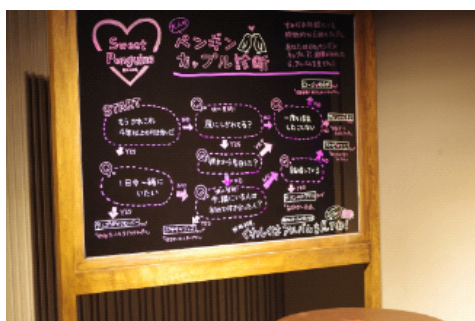
ペンギンカップル診断 昨年の様子

開催日：2017年1月28日(土)～3月14日(火) 開催時間：9時00分～21時00分 開催場所：すみだステージ 開催内容：日比谷花壇の花で華やかに装飾されたオリジナルの「ペンギンカップル診断」を設置します。「ペンギンカップル診断」では、カップルにちなんだ質問に答え、お客さまと似た『すみだ水族館』のペンギンカップルのタイプを診断しお楽しみいただけます。