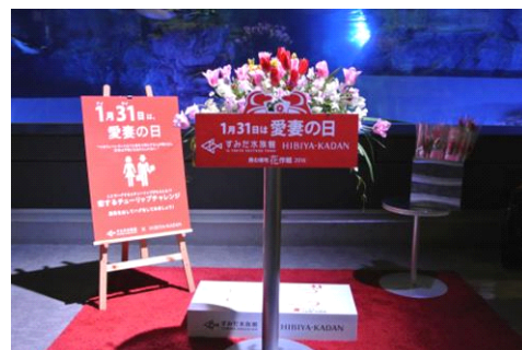
特設ステージ（昨年の様子）

開催内容：カップルや夫婦が足型にあわせて立つとハグすることができる「日本愛妻家協会×日比谷花壇 特製ハグマット」をベースにあしらい、花を使った鮮やかな装飾をした特設ステージを設置します。カップルで寄り添う仲むつまじいペンギンたちを見習って、この上で勇気を出してハグをしたお客さま各日先着50組さまに“永遠の愛”が花言葉のチューリップと、自宅で使える特製ハグマットをプレゼントします。