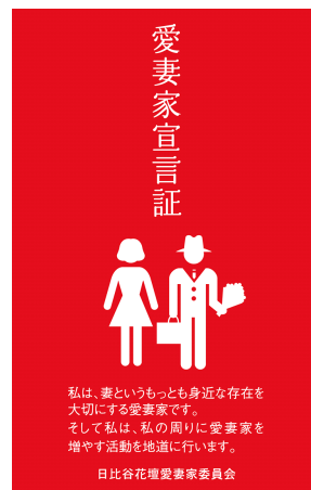
日比谷花壇特製 愛妻家宣言証

「愛妻家宣言証」は、“私は、妻というもっとも身近な存在を大切にする愛妻家です”という宣言付きの名刺サイズのカードで、宣言証の裏には、愛妻家として忘れてはいけない“奥さまの誕生日”、“結婚記念日”、“お二人だけの記念日”を書き込めるようになっています。“いい夫婦の日(11/22)”、“愛妻の日(1/31)”、“バレンタインデー(2/14)”と合わせて、これら6つの記念日の前後1週間以内に、全国の日比谷花壇店舗（一部店舗除く）にこの「愛妻家宣言証」を提示すると、商品が10%割引になります。割引特典は、2018年1月31日まで有効で、割引対象は、店頭持ち帰り商品となります。（※カタログ商品、宅配商品は、愛妻家宣言証による割引の対象外となります。）