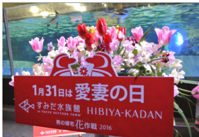
特設ステージ(昨年の様子)