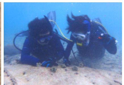
2017年2月2日に 36株のサンゴの移植を行いました。