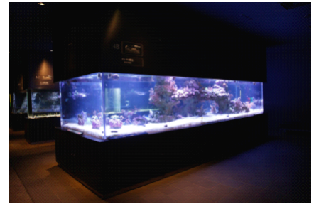
サンゴの展示水槽 幅5.5m 奥行2m 水深1.3m 飼育には人工海水を使用

展示生物：シコロサンゴ、スリバチサンゴなど 展示期間：常設 展示場所：6階「サンゴ礁」ゾーン 展示内容：13種類の沖縄のサンゴを育て展示しています。360度全方向から、美しいサンゴと、サンゴと関わって暮らす魚や貝などのいきものたちを観察できます。