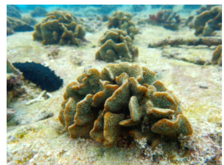
3年前に沖縄に移植したサンゴの苗 だんだん大きく育っています。