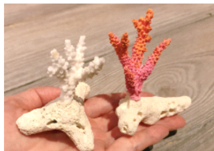
ツアーの最後に白いサンゴの骨格に色を塗ります。