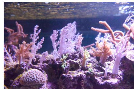
色とりどりのサンゴ

開催日：2017年3月5日(日) 開催時間：11時45分～、12時45分～、13時45分～ 16時15分～、17時30分～、18時45分～ (計6回、各回約20分間) 開催場所：6階 サンゴ水槽、サンゴアカデミー 参加方法：当日受付 参加対象：小学3年生以上 参加定員：各回6名 開催内容：飼育スタッフによるサンゴ水槽の解説を聞きながら、サンゴの給餌や、白くなったサンゴと元気なサンゴの比較展示などを観察しながら、サンゴの色の美しさや大切さを体感するツアーです。プログラムの最後には、サンゴが元気に色づくよう、サンゴの骨格に色を塗っていただきます。色づいたサンゴの骨格と同じ株数のサンゴの苗を、沖縄の海に移植します。