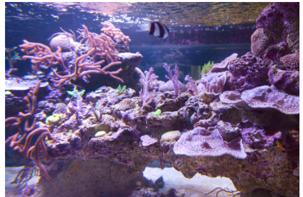
『すみだ水族館』のサンゴ水槽