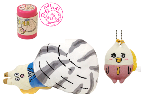
「朝だよ！貝社員」グッズ