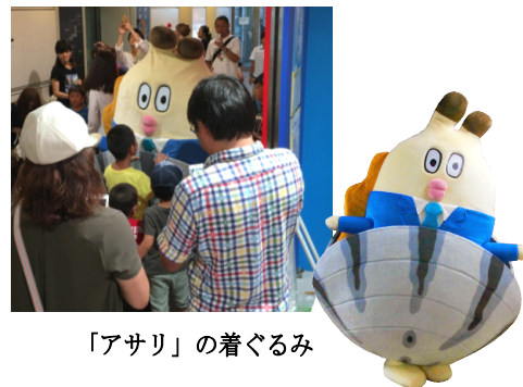
「アサリ」の着ぐるみ

展示内容：人気の「朝だよ！貝社員」キャラクター「アサリ」の着ぐるみグリーティングを開催します。すみだ水族館館内で“アッサリ”と登場し、“アッサリ”と貝殻を取ったりします。