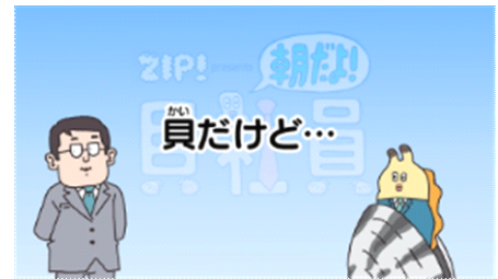
ゆるゆる“貝”説の映像イメージ