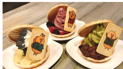
左から「もな貝社員 アサリ(塩バニラ)」「もな貝社員 ハイ貝(イチゴ)」「もな貝社員 カモ貝(抹茶)」

販売内容：貝殻の形のもなかに、「朝だよ！貝社員」のキャラクターの絵柄のクッキーとソフトクリームを挟んだオリジナルメニューです。アサリ(塩バニラ味)、ハイ貝(イチゴ味)、カモ貝(抹茶味)の全3種を販売します。