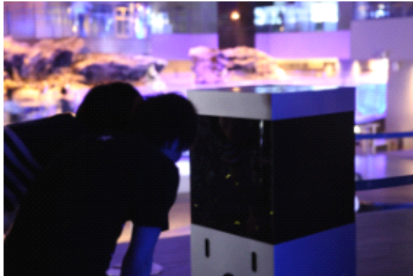
ホタルの展示風景 ※昨年の様子