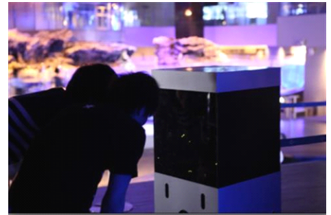
ホタルの展示風景 ※昨年の様子

ホタルは、世界で約2,000種いるとされており、そのうち日本には約40種のホタルがいます。代表的なホタルは、水田に多いヘイケボタル、川に多いゲンジボタル、山に多いヒメボタルです。普通、ホタルは陸上で生活しますが、ヘイケボタルとゲンジボタルは例外で幼虫の時代を水中で過ごす世界的にも珍しいホタルです。