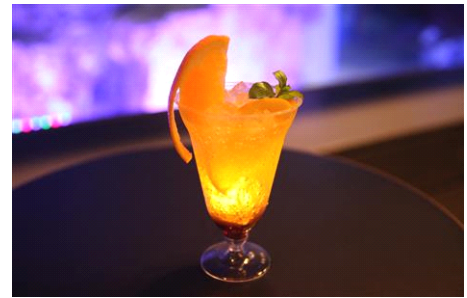
ほたるのひかりカクテル

販売期間：2017年6月14日(水)～6月18日(日) 販売時間：各日18時～21時 販売場所：5F ペンギンカフェ 販売価格：650円(税込) 販売内容：清流で光るホタルをイメージして作られたカクテルです。カシスソーダをベースに、夜空に浮かぶ月に見立てたオレンジや、さわやかな初夏の風を思わせるミントをあしらいました。