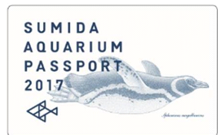
すみだ水族館 年間パスポート