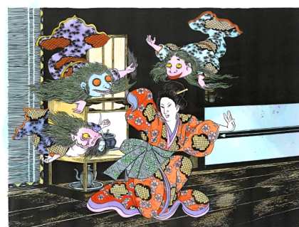
水木しげるが描いた「金魚の幽霊」