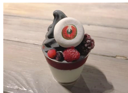
「目玉おやじの目玉パフェ」

販売内容：水木しげるが描いた妖怪「目玉おやじ」をイメージしたパフェです。イチゴソースのかかった牛乳プリンの上にベリーとソフトクリームをトッピングし、目玉のマシュマロをのせました。