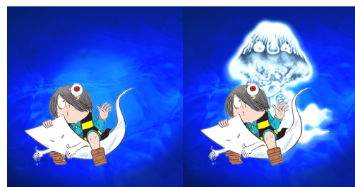
「水の妖怪フотスポット」イメージ

展示内容：お馴染みの「ゲゲゲの鬼太郎」に登場するキャラクターたちと一緒に記念写真が撮れるフотスポットです。パネルの前に立ってフラッシュ撮影をすると、目では見えなかった妖怪が人物の背後に不気味に浮かび上がります。