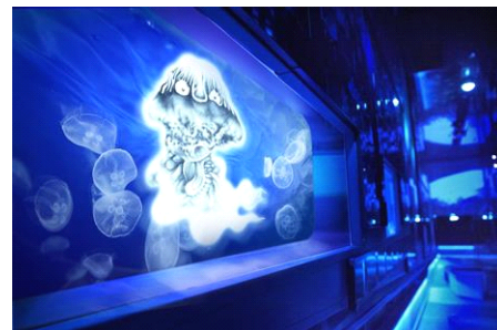
「水木しげる×すみだ水族館 水の妖怪トンネル」イメージ

薄暗い照明や恐怖心をあおる音響効果に加えて、本企画のために開発された昼と夜で異なる2種類のアロマなどにより、思わず進むことをためらってしまう空間となっています。