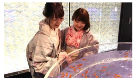
和の空間「江戸リウム」はおすすめのフотスポット