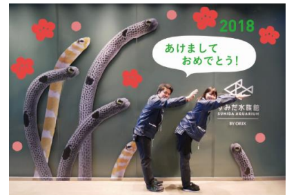
「チンアナゴウォール お正月バージョン」イメージ

設置内容：戌年にちなんで、犬の「狎(ちん)」が名前の由来であるチンアナゴのフотスポットを設置します。新年の水族館に来館いただいた記念写真を、ポーズを工夫して楽しみながら撮ることができるフотスポットです。