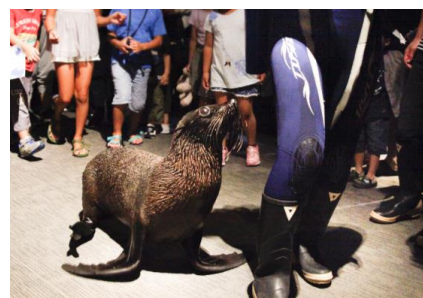
「お正月！オットセイパレード」イメージ

※参加者は、14時10分に館内インフォメーションに集合いただき、体験プログラム「お面でおット！福笑い」でお面を作った後、飼育スタッフ・オットセイと一緒に館内を歩いていただきます。