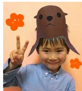
オットセイのお面 イメージ