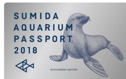
年間パスポート 2018年新デザイン

販売内容：2018年新デザインのすみだ水族館年間パスポートを販売します。戌年にちなんで、券面も犬のなかまであるオットセイのデザインになっています。