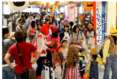
「ハロウィン・ファミリーパレード」

開催内容：東京スカイツリータウンでは、ファミリーを中心にみんなで仮装して楽しむ、今年で6回目となる「ハロウィン・ファミリーパレード」を開催します。ソラマチひろばをスタートし、ハロウィーン装飾で彩られたソラマチ商店街やソラミ坂ひろばをお菓子をもらいながら練り歩き、スカイアリーナへ向かいます。