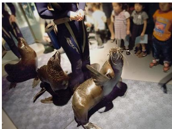
オットセイと一緒にパレードしましょう！