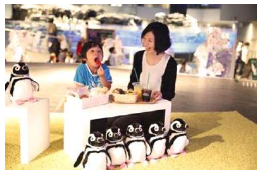
「ペンギンハナミテラス」イメージ