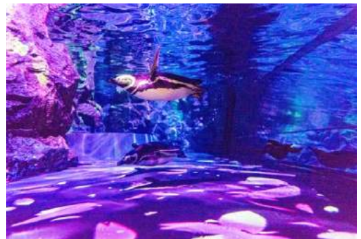
「ペンギンピクニック」(5階から見た様子)