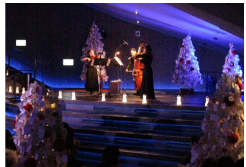
過去開催時のようす

開催内容：夜の水族館でクリスマスソングの演奏会を行います。新日本フィルハーモニー交響楽団が奏でる弦楽器や木管楽器の音色に時折りペンギンたちの鳴き声が変わり、演奏会を盛り上げます。「ペンギンと音楽の夜」開催中は、特別にプロジェクションマッピング「Penguin Candy」の音楽に、楽団の生演奏も加わります。