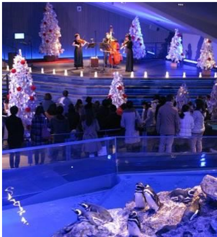
限定演奏会「ペンギンと音楽の夜」(12/22～24開催)