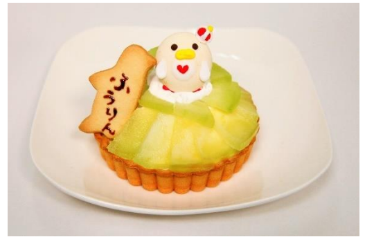
「ふうりん」お祝いメニュー

販売内容：タルトにホイップとカスタードを絞り、その上にすみだ水族館生まれのペンギンたちの共通バンドカラー緑色の果物メロンを敷き詰めました。センターには王冠を被ったペンギンマカロンが君臨！一緒に添えられたペンギン型のクッキーには一位の「ふうりん」の名前を入れてご提供します。