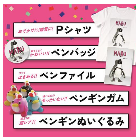
「まる」お祝い公式グッズ