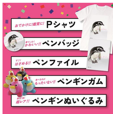
「ふうりん」お祝い公式グッズ