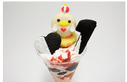
「まる」お祝いメニュー

販売内容：出羽した11羽に合わせて桃やパイナップルなど11種類のフルーツが入った豪華なフルーツパフェです。パフェの上には、ペンギンカラーの白黒で「ハート」と一位を表す数字の「1」を型取った手作りクッキーをトッピング。中央には王冠を頭にのせたかわいいペンギンマカロンがのっています。