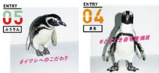
センターの栄冠に輝いた「ふうりん」と「まる」

超選挙すべての結果は、イベント特設ウェブサイト、館内の掲示板上で確認いただけます。