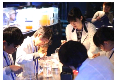
「クラゲ研究員」開催の様子

開催日：3月25日(土)・3月26日(日) 開催時間：各日11時～12時 募集対象：小学校3年生～6年生 募集定員：1日1回、各回6名 参加方法：すみだ水族館ホームページから事前申し込みが必要です。 応募者多数の場合は抽選となります。 開催内容：飼育スタッフと同じ白衣を着て、クラゲについて研究するプログラムです。クラゲをより身近に感じることができます。