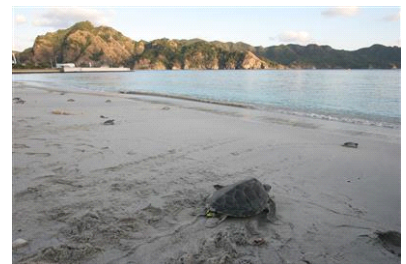
海へ帰るアオウミガメ②