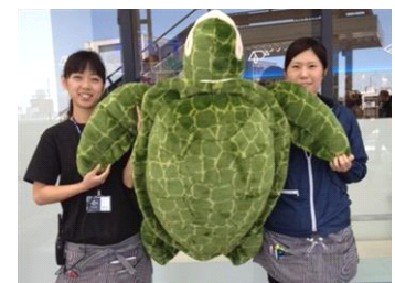
特大ウミガメぬいぐるみ

すみだ水族館で育った1歳のアオウミガメは20センチ程度ですが、成長すると1メートル程になります。今回は、そんな成長したアオウミガメを彷彿とさせる特大のウミガメぬいぐるみを数量限定で販売いたします。