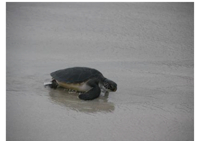
海へ帰るアオウミガメ①

今回、飼育スタッフと一緒に『すみだ水族館』でアオウミガメの飼育体験を行い、小笠原諸島で放流活動を行う「飛び出せ！ウミガメ研究員」を募集します。アオウミガメの生態を学び、実際に小笠原諸島で放流をすることは、夏休みの貴重な経験となるはずです。