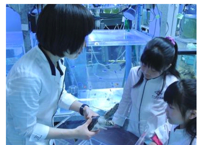
「ウミガメ研究員」イメージ