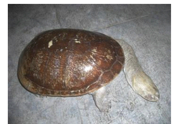
チリメンナガクビガメ