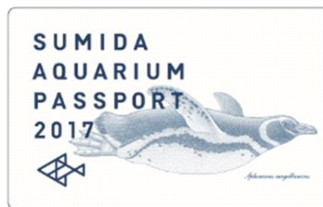
すみだ水族館 年間パスポート

開催内容：期間中、『すみだ水族館』の年間パスポートを新規でご購入または更新していただいた方に、「ペンギン赤ちゃんミニソフト」をプレゼントします。初遊泳に挑戦した赤ちゃんが他のペンギンたちと一緒にどのように成長していくのか、その姿を年間パスポートご持参の上見に来てください。