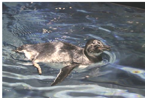
まだ泳ぐことに慣れていない赤ちゃんの様子(昨年)

※初遊泳後、6月23日(金)からは徐々に展示プールで泳ぐ時間を増やしていく予定です。