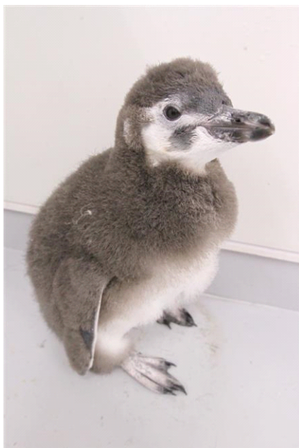
マゼランペンギンの「はっぴ」

『すみだ水族館』(所在地:東京都墨田区、館長:田海 雅彦)は、2014年4月30日(水)に誕生したマゼランペンギンの赤ちゃんの名前を皆さまからいただいた約2万通のご応募から「はっぴ」に決定し、2014年7月28日(月)にバックヤードから他のペンギンが暮らすペンギンプールに引越しをします。また、夏の特別イベントとして、著名アーティストが館内で生演奏を行う「ペンギンと音楽の夜」を7月18日(金)より開催しますので、お知らせします。