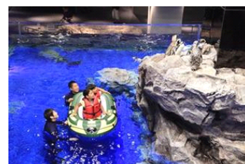
ペンギンクルーズ

内 容：マゼランペンギンの生態を学んだ後に、ペンギンプールをボートに乗って一周します。ペンギンに大接近して、生態を観察することができます。