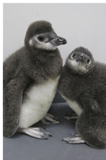
名前を募集する2羽の赤ちゃん

また、『すみだ水族館』では、夏休み期間にペンギンの魅力をさらにお伝えするため、ペンギンに関する3つのワークショップを開催します。夕方、寝る準備を始めたペンギンがどんな行動をするのかを飼育スタッフと一緒に、スワロフスキー・オプティック社製の高品質な双眼鏡で観察する「ペンギンワッチ」、ペンギンを間近で観察するためにペンギンが泳ぐプールをボートに乗って一周する「ペンギンクルーズ」、かわいいペンギンのお面をつくる「ペンギンのお面をつくろう」の3種類のワークショップを実施します。夏休み期間限定で開催するワークショップで、ペンギンを身近に感じていただき、ぜひ赤ちゃんの名前をご応募ください。