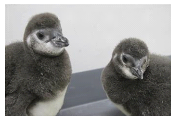
名前を募集する2羽の赤ちゃん