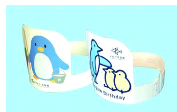
ペンギンのお面をつくろう