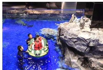
ペンギンクルーズ

<本件に関するお問い合わせ先> すみだ水族館 広報室/村木・久我 ■ TEL:03-5619-1284 ■ MAIL:press-sumida@orix-aqua.co.jp