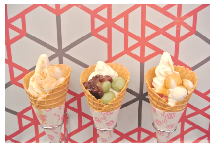
左から黒蜜きなこ味、草団子味、みたらし味

商品内容: 葛飾北斎にちなんだ和の味わいのソフトクリームです。黒蜜きなこ、草団子、みたらしの3種類をご用意しました。ソフトクリームは、塩パニラ味と抹茶味から選べます。