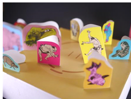
「北斎とんとん相撲」イメージ