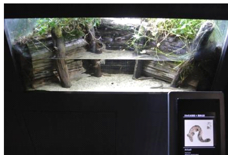
ドジョウの水槽と葛飾北斎の描いた浮世絵

『すみだ水族館』では、2013年夏から葛飾北斎が描いた浮世絵のなかのいきものと、実際のいきものを見比べる展示を行っています。葛飾北斎は代表作『北斎漫画』で、東京湾や東京の河川のいきもの絵を描いており、中にはナマズやウナギ、ドジョウなど身近ないきものを描いた作品もあります。馴染みのある東京湾や東京の河川のいきものを、葛飾北斎が描いた浮世絵の作品とともに展示することで、葛飾北斎を身近に感じていただくとともに、いきものたちの新たな魅力も再発見できます。