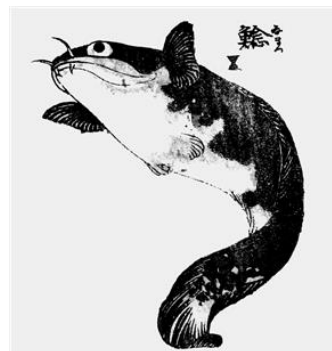
北斎かるた イメージ

名称 : 「ひねってあそぼう、北斎かるた。」 開催期間 : 2016年12月26日(月)～2017年1月9日(月) 開催時間 : 各日10時00分～16時00分 開催場所 : アクアアカデミー 参加定員 : 各日先着200名(無くなり次第終了) 開催内容 : 北斎のおさかなハンコを押してオリジナルの北斎かるたを作ることができます。「さ、か、な、ほ、く、さ、い」の7文字を頭文字にしたかるたに、好きな文句を作って遊びます。 ※実際にかるた遊びはしていただけません。