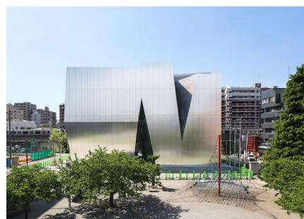
『すみだ北斎美術館』