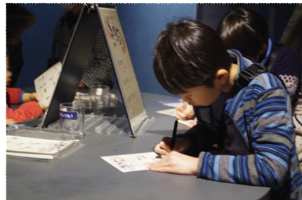
館内設置のワークシートに答えていきます

名称 : 「北斎のさかなを、探せ。」 開催期間 : 2016年10月1日(土)～2016年12月25日(日) 開催時間 : 各日10時00分～16時00分 開催場所 : アクアアカデミーなど 参加定員 : 各日先着200名(無くなり次第終了) 開催内容 : 館内の葛飾北斎に関するいきものを観察して、ワークシートの問題に答えていきます。北斎は実際にその目で確かめて魚を描いたのか、浮世絵の中に描かれたいきものと実際のいきものを見比べてみましょう。全問正解で合格スタンプを押してもらえます。