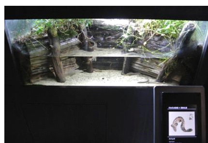
北斎の描いた浮世絵のドジョウと 実際のドジョウを見比べる展示