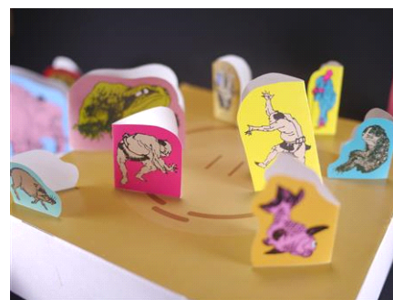
「北斎とんとん相撲」イメージ