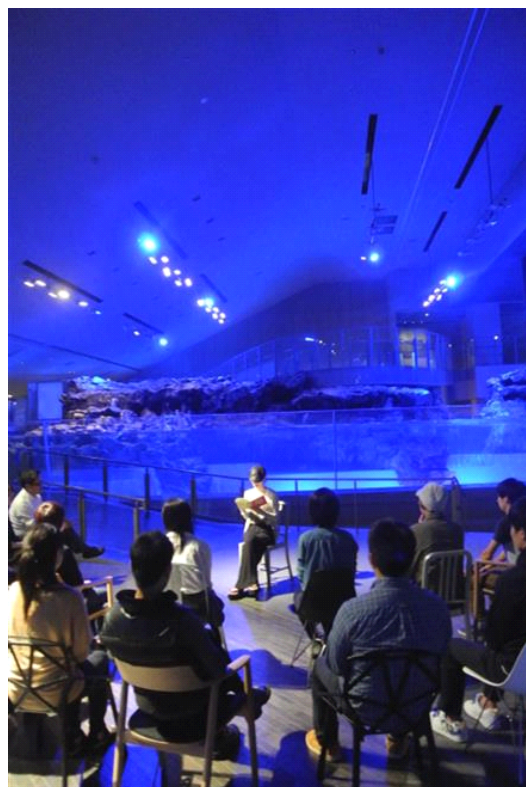
「夜の朗読会」のイメージ

日頃忘れがちな声の豊かさや深みに包まれる空間の中で、いきものの素晴らしさを感じることができる「夜の朗読会」は、アーティストと水族館がコラボレーションした新たな取り組みです。今後も、すみだ水族館は水族館での新しい過ごし方を提案してまいります。