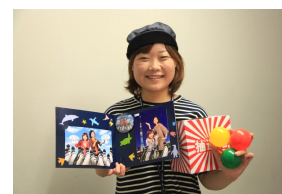
初笑いくじのイメージ

1ポーズを撮影されたお客さまは、3分の2の確率で金券が当たるくじを引くことができます。