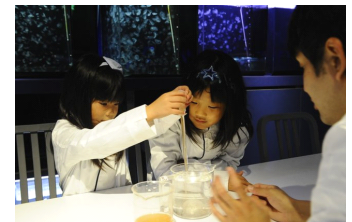
叶える夢のイメージ写真 (飼育員体験)