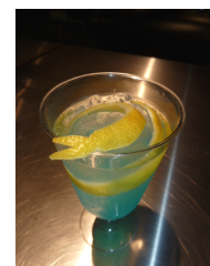
スネークカクテル

レモンを丸ごと一個使いサッパリとした味わいの「スネークカクテル」。レモンピールをへびに見立てた、見た目もかわいいカクテルです。