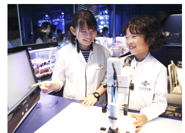
キッズ研究员イメージ

内容：クラゲに餌をあげたり、水槽の水を換えたりといった飼育体験を通じてクラゲの生態を理解し、生き物への興味を高めていただくプログラムです。アクアラボで実際に飼育スタッフと一緒にクラゲの研究をします。