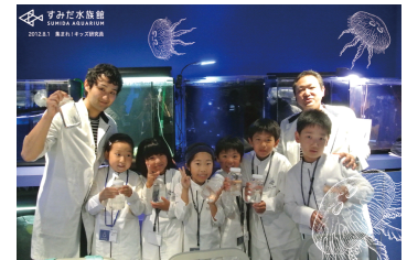
夏休み実施時の記念写真

夏休みにも実施して大好評だった「集まれ！キッズ研究员」を、もう一度やってほしいという皆さまの声にお応えして、冬休みにも実施します。「クラゲに心臓はあるの？」「クラゲって何を食べるの？」「クラゲってどうやって生まれるの？」など、体験を通じてクラゲに対する疑問が解決するプログラムです。