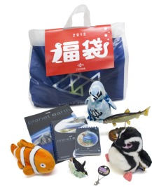
新春福袋の商品例

マゼランペンギンのぬいぐるみやかわいい水族館グッズなど、6,000円相当の商品が入った新春福袋を数量限定150個で販売します。