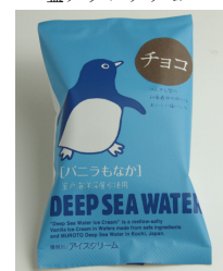
チョコアイスもなか