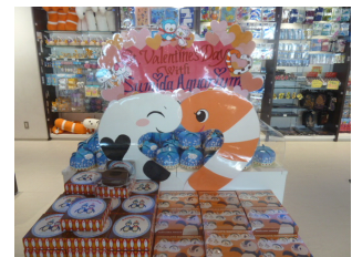
コーナーイメージ