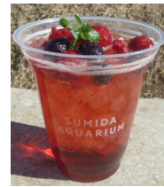
AQUA CUBE カクテル