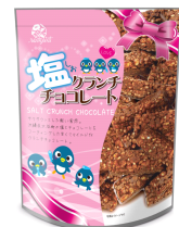
塩クランチチョコ