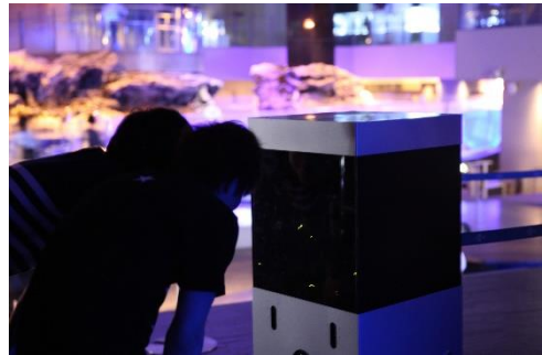
ホタル展示イメージ (過去開催のようす)

展示内容：東武動物公園の「ほたリウム」で飼育するヘイケボタルの特別展示を行います。照明を落とし暗くなった「アクアアカデミー」で、水槽内でホタルが発光するようすをご覧ください。夜の水族館でのホタル鑑賞を通じて、ぜひ初夏の訪れを感じてください。