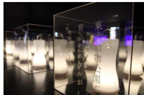
「ホタルからのメッセージ」イメージ

開催内容：LED ランタンの中に置いたミラーボックスを各所に設置します。ホタルの特徴を詩にした「ホタルからのメッセージ」がランタンの光で浮かび上がり、幻想的な雰囲気を作り出します。 万華鏡トンネルを歩きながら、ホタルの生態を楽しく学びましょう。