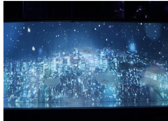
クラゲ水槽の背面に雪景色の映像

すみだ水族館（所在地：東京都墨田区、館長：名倉 寿一）は、2019年11月16日（土）～2020年2月27日（木）の期間、都会の雪景色とクラゲの世界観を体感できるインタラクティブアート「雪とクラゲ」を開催しますのでお知らせします。