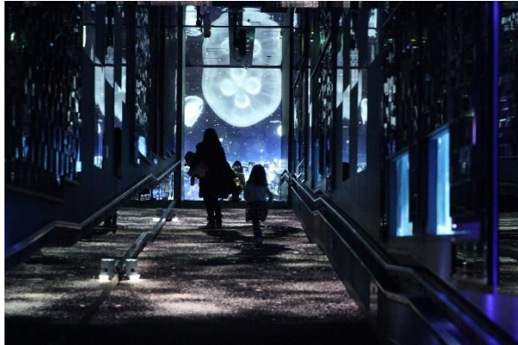
「雪とクラゲ」前回のようす