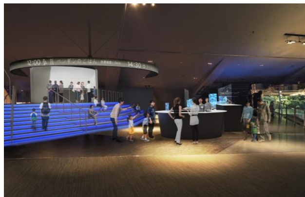
新しくなるオープンな飼育作業エリア（イメージ） ※現「すみだステージ」

本リニューアルでは、クラゲの飼育作業などを観察できる「アクアラボ」、水槽が絵画のように並んでいる「アクアギャラリー」および、多目的スペース「すみだステージ」を全面改修し、いきものや飼育作業をより間近に観察できる2つの新エリアを開設します。