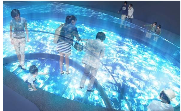
張り出すガラス床（イメージ）

現在クラゲを展示している「アクアラボ」、水槽が絵画のように並んだ「アクアギャラリー」を全面改修します。約2倍の広さに拡張する新しい「クラゲエリア」には、長径7メートル、短径3メートルの水盤型水槽を新設します。ふわふわと漂う約500匹のミズクラゲを、上から直に観察できます。水盤の一部には、水面に張り出すガラスの床のデッキを設置し、足元をクラゲが横切り、まるで水面に立っているような浮遊感を感じます。