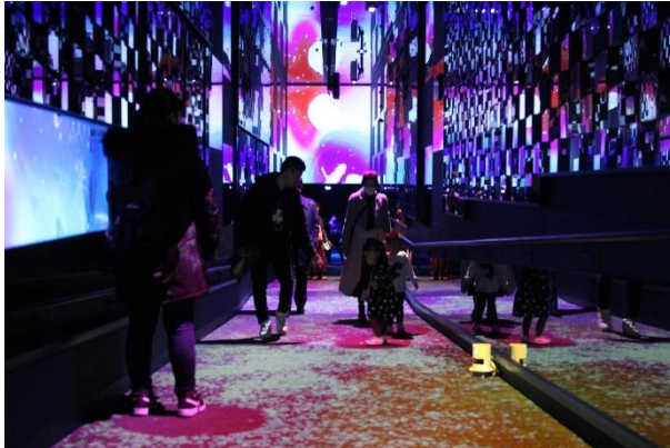
昨年開催した「桜とクラゲ」のようす