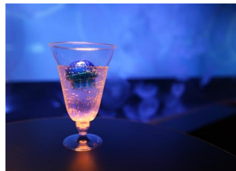
「桜とクラゲソーダ」