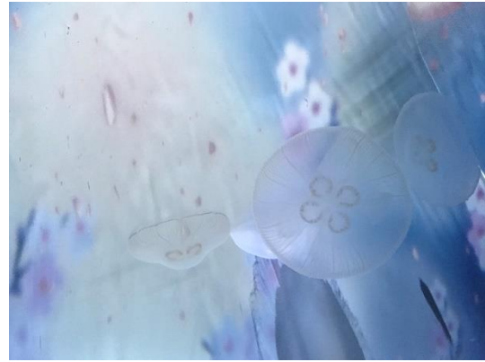
クラゲ水槽の背面に桜の映像

すみだ水族館（所在地：東京都墨田区、館長：名倉 寿一）は、2020年2月28日（金）～4月27日（月）の期間、クラゲと一緒に「お花見体験」が楽しめるインタラクティブアート「桜とクラゲ」を開催しますのでお知らせします。