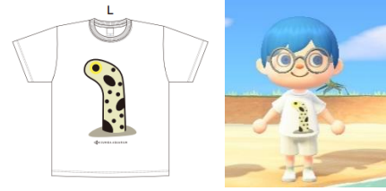
オリジナルTシャツ イメージ