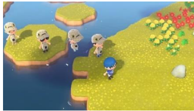
ファンミーティング イメージ