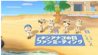
フォトスポットでの記念撮影

また、ファンミーティングのようすは、YouTube チャンネルおよび館内設置モニターでライブ配信し、どなたでもご覧いただけます。