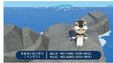
「すみすいなりきりセット」ペンギン