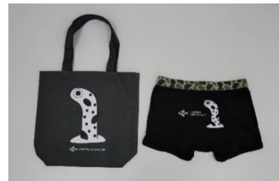
（左）チンアナゴ トートバッグ ／（右）チンアナゴ 缶パンツ