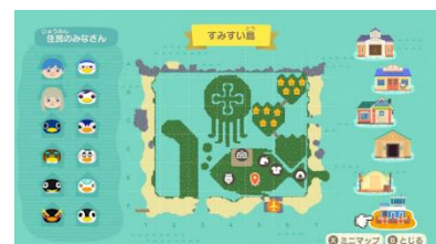
「すみすい島」全体イメージ

そのほか、「かんちょうさん」の自宅部屋や執務室、展示の再現など、こだわりと遊び心がちりばめられています。