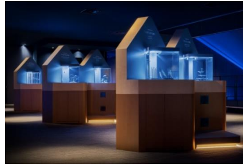
企画展「カタチとくらし」の様子

本企画展は、小さいいきものの姿形や習性にちなんでデザインした“人工のすみか”を6つの水槽内に設置し、いきものの暮らし方を観察できる展示として、2020年1月31日から2月29日、6月15日から7月14日に開催しました。