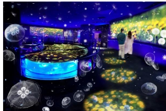
「たんぽぽとクラゲ」イメージ

本企画では、国内最大級の長径7mの水盤型水槽「ビッグシャーレ」およびその周辺の壁や床を用いて、春の訪れを象徴する「たんぽぽ」で空間を演出します。左右の壁面に投影される映像は、地上で綿毛となり“ふわふわ”としながらも力強く舞い遠くまで飛んで、また花を咲かせるたんぽぽと、海を“ふわふわ”と漂いながら輪廻するクラゲの一生をリンクさせたストーリー仕立てになっています。さらに、壁面のストーリーに合わせて床面の映像も変化します。水槽には、本企画にあわせて通常とは異なる色の照明を施し、空間全体で春を感じていただける内容となっています。