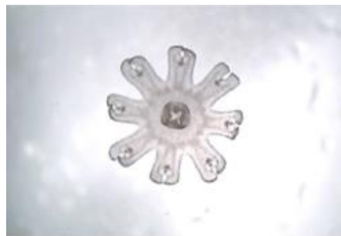
綿毛のようなミズクラゲの赤ちゃん“エフィラ”