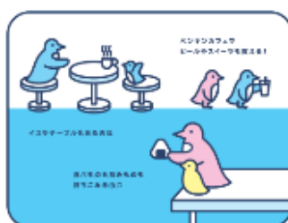
親子にやさしいすみだ水族館 お弁当持って、親子でピクニック気分