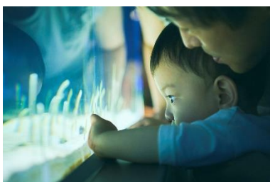
いきものと近くで出会える

お子さまのお出かけの際に気になるのが、授乳室などの設備。すみだ水族館には、おむつ替え台が計8台あります。授乳室は各階1カ所ずつあり、どちらもミルクが作れる給湯器付きです。また、定期的な換気やお客さまの手が触れやすい箇所を頻繁に消毒するなど、「三密回避」と「衛生管理対策」に努めています。