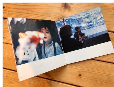
水族館デビューアルバム イメージ