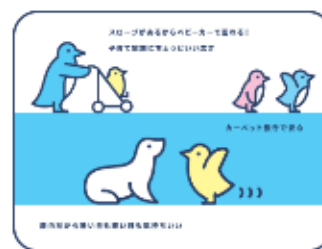
親子にやさしいすみだ水族館 ほどよい広さで、親子にぴったり