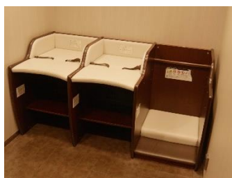
おむつ替え台も充実