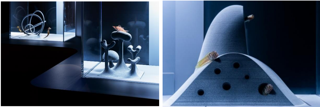
左：「ぐるぐるの家」×ビッグベリーシーホース 右：「によきによきの家」×クダゴンベ