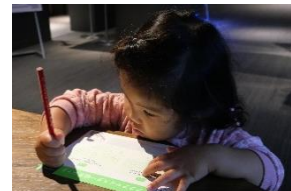
体験プログラム (イメージ)

いきものにふれ、近くに感じるからこそ得られる子どもたちの興味関心を育みます。楽しみながら環境問題への気づきや、視野を広げる想像力を養うきっかけづくりを目的とした体験プログラムを実施しています。