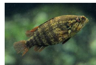
京都府登録天然記念物「オヤニラミ」

近年は環境の変化により、多くの種が絶滅の危機にひんしています。京都水族館では京都府に生息する絶滅危惧種の保全を目的とし、淡水魚や両生類の生息域外保全や飼育下での繁殖に取り組んでいます。技術向上のため他府県種や外国種の繁殖も試みてきた結果、これまで例のない種の繁殖にも成功するなど、種の保全に寄与しています