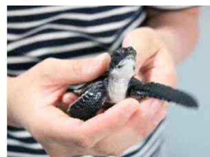
京都水族館・すみだ水族館の「AQTION!」活動（イメージ）

「AQTION!」には、「AQUARIUM (アクアリウム)」からはじまる「ACTION (アクション)」という意味が込められています。水族館だからこそ見えてくる地球や社会の課題に対して、未来を担う子どもたちや地域社会と一緒に取り組む活動です。水族館で生まれた気付きの芽が、未来を変える行動につながってほしいとの想いを込めています。