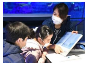
飼育研究取り組みのようす

地域のコミュニティーの一員として、行政や地域住民と一緒にあって、子どもたちの夢や悩みに寄り添い、感性を育む取り組みをしています。例えば「飼育スタッフになりたい」という夢にスタッフが応えたり、夏の自由研究に水族館と一緒に取り組んだり、子どもたちに水族館に来館する機会を提供したり。水族館が地域の資源となり、子どもたちの豊かな未来と一緒に考える存在になりたいと思っています。