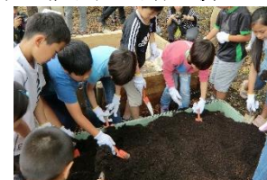
事業連携イベントのようす

京都市動物園・京都府立植物園・京都市青少年科学センターと事業連携を行っています。それぞれの専門性を生かした展示協力やイベントの共同企画などを通して、次世代へ京都の自然環境の継承を呼びかけるさまざまな取り組みを行っています。