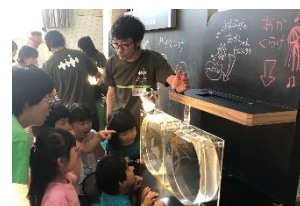
移動水族館のようす

行政や地域企業と連携し、地域の子どもたちの教育活動を実施しています。京都市内の幼稚園では移動水族館「京都水族館クラゲSTUDIO」やワークショップの開催、小学校ではオオサンショウウオの生態を学ぶ環境学習の出張授業、企業や団体と共同開催するワークショップなどを通じて地域貢献に取り組んでいます。