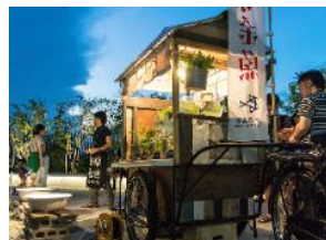
東京金魚プロジェクトのようす

すみだ水族館のある東京には、かつて金魚の養魚場がたくさんあり、多くの家で金魚は家族の一員でした。「東京金魚プロジェクト」はそんな東京の金魚文化を未来につなぐことを目的としています。金魚売りがいきものを介して地域のコミュニティーをつかったように、水族館外での活動も展開し、金魚を通して暮らしの中でいきものをめぐるやさしい気持ちの大切さも伝えます。