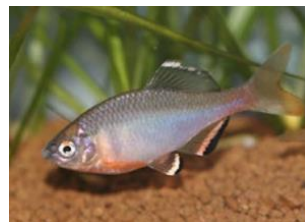
国の天然記念物「ミヤコタナゴ」

すみだ水族館のある東京でもかつて多くの水生生物がすんでいましたが、ミヤコタナゴ、トウキョウサンショウウオ、ミナミメダカなど、都内のあちこちに生息していたいきものたちが、すみかを追われ、既に絶滅してしまったり、絶滅の危機にひんしたりしています。すみだ水族館では、いきものたちの今を伝えると共に、各種機関と協力しながら種を絶やさないための保全活動にも取り組んでいます。