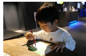
体験プログラム (イメージ)

いきものにふれ、近く感じたからこそ得られる子どもたちの興味関心を育みます。楽しみながら環境問題への気づきや、視野を広げる想像力を養うきっかけづくりを目的とした体験プログラムを実施しています。