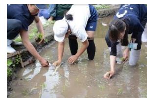
「京の里山」田植えのようす

京都の原風景を再現した「京の里山」エリアでは、水、いきもの、食物、そして人とのつながりや、生物多様性の大切さを伝えていきます。また、近隣の小学校と連携し、田植えから脱穀・精米・しめ縄づくりまで、昔の人々の苦労を体験しながらお米を育てる過程を学ぶほか、四季折々の姿を見せる里山で一年を通じて授業を行っています。