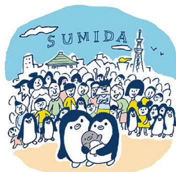
プロジェクトイメージビジュアル

プロジェクト第 1 弾として、ペンギンがデザインされた「すみだ水族館 10 周年婚姻届」を作成し墨田区に寄贈しました。この婚姻届は、墨田区役所をはじめ、当館などで配布し、全国の自治体へ正式な書類としてご提出いただけます。