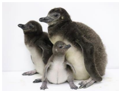
今年誕生したペンギンの赤ちゃん