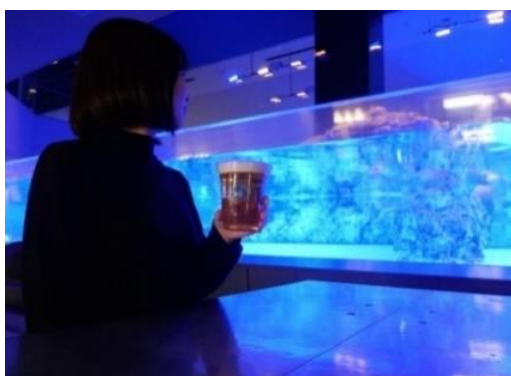
「すみだ夜 cafe チケット」で過ごすイメージ