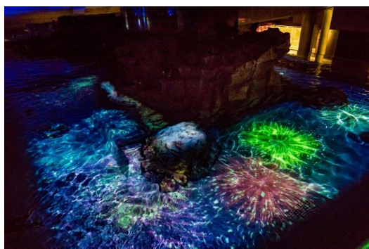
「ペンギン花火」イメージ