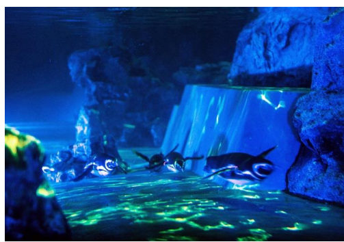
光の中を泳ぐペンギンたち