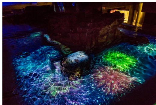
「ペンギン花火」イメージ

「夏の夜すい」は、日中の暑さを避けて、落ち着いた夜の水族館をお楽しみいただける夜限定のプログラムです。17時半以降、だんだんと館内の照明が暗くなり、18時には夜の青色の照明「ブルーナイトアクアリウム」に切り替わります。そんな幻想的な照明の中、音楽に合わせて花火の映像をプロジェクションマッピングで映し出す「ペンギン花火～10周年バージョン～」を、日本最大級※の屋内開放型ペンギンプールにて19時より開催します。