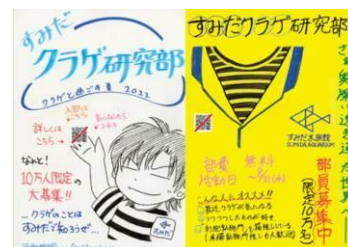
部員募集ポスターイメージ

部員募集の大型広告が「新宿」駅に登場します。部活動誘いの立て看板のような、どこか懐かしい手書き感と熱意のこもったグラフィックに仕上げました。実際に当館のスタッフが描いたポスターも採用し、「新宿」駅の東口と西口を結ぶ通路に立体形状の9種類の部員勧誘ポスターが並びます。