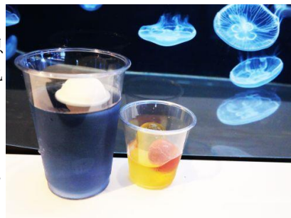
早変わり！ クラゲのライムミントティー