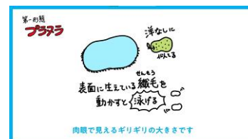
「ミズクラゲの生活史」映像イメージ