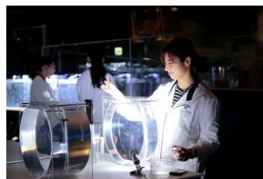
5階アクアベース「ラボ」

本企画では、“クラゲを人間の枠組みで考えない”をコンセプトに、飼育スタッフを先輩部員、お客さまを新入部員とした「すみだクラゲ研究部」を結成します。種類によって異なる特長を持ち、いまだ解明されていないことの多いクラゲを、“鑑賞”のスタイルではなく、じっくりと観察することで、クラゲの奥深い魅力を体感いただけます。