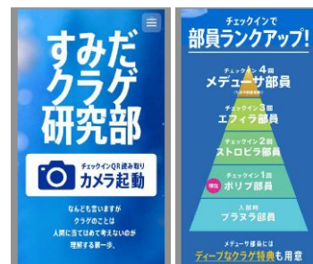
部員専用ウェブサイトイメージ