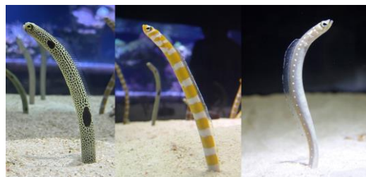
すみだ水族館で飼育している三種。 左から チンアナゴ、ニシキアナゴ、ホワイトスポッテッドガーデンイール

スタンプラリー形式で、チンアナゴ、ニシキアナゴ、ホワイトスポッテッドガーデンイールの三種が記念日名をかけてナワバリバトルをするゲームです。参加者は、三種の特長や違いが書かれた館内 9 カ所の三国チンスポットをめぐり、推したい種を選びます。スタンプラリー終了後に獲得できるナワバリシールを、推したい種のナワバリへ貼り付けていただきます。ナワバリが一番大きかった種には、「チンアナゴの日」のような記念日の称号を授与予定です。