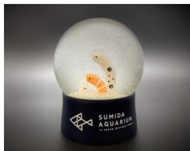
チンアナゴスノードーム （画像はイメージです）

※ペンギンカフェ、ミュージアムショップの営業時間は、水族館の営業時間と同様です。