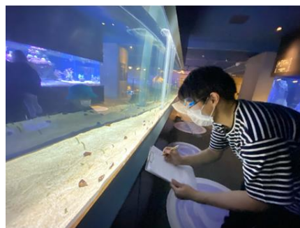
飼育スタッフが調査するようす

お客さまからの「チンアナゴはなぜお引越しをするの？どのくらいお引越しをしているの？」という鋭い質問をきっかけに、飼育スタッフが431日にわたり行った、「すみだ水族館のチンアナゴの巣穴の移動」に関する観察結果を館内に掲示します。飼育するチンアナゴのうち、模様や色に特徴がある6匹に愛称をつけ、移動回数を記録しました。これを見ればすみだ水族館のチンアナゴのことをより深く知っていただけます。