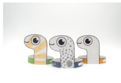
三種のチンアナゴお面