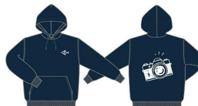
スタッフ 着用ユニフォーム（イメージ）

館内を回遊しながらお客さまをインスタントカメラで撮影するスタッフが登場します。撮影した写真はその場で 1 枚プレゼントします。撮影スタッフには、千葉大学写真部の皆さんも参加。インスタントカメラならではの趣のある、とっておきの 1 枚を受け取ってください。