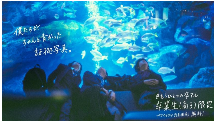
「#もうひとつの卒アル」 キービジュアル

すみだ水族館（所在地：東京都墨田区、館長：毛塚 広治）は、2024年3月8日（金）～3月31日（日）の期間、卒業など人生の節目を迎える皆さまを対象に、特別な思い出作りをお手伝いする「思い出増量プロジェクト」を開催します。さらにイベント期間中の最後の2日間は特別企画として「#もうひとつの卒アル」を実施します。