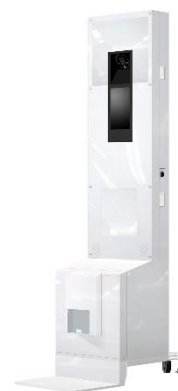
オリジナルプリントシール機 （イメージ）