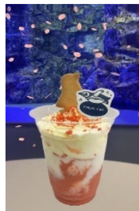
ハッピースプリングシェイク （イメージ）