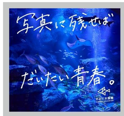
特設フォトスポット（イメージ）