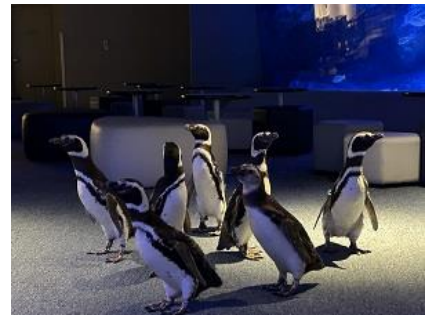
7羽のお散歩のようす

7羽が館内をお散歩するようすをご覧くださいことができます。 7羽は、開館前にほぼ毎日すみだ水族館内をお散歩してきましたが、お客さまがいる状態での散歩は今回が初めてとなるため、ご観覧希望のお客さまはスタッフの案内に従ってペンギンたちをお待ちください。また、大きな声は出さず、静かにご覧くださいようお願いします。