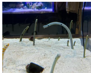
チンアナゴカメラ イメージ