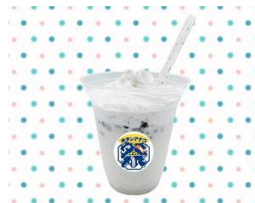
大チンアナゴ祭シェイク イメージ