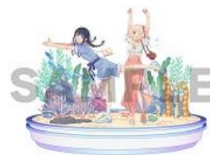
リコリス・リコイル コラボイラスト

「さかな〜」、「チンアナゴ〜」のシーンでおなじみのテレビアニメ「リコリス・リコイル」とのコラボレーションを実施します。「千束（ちさと）」がチンアナゴのポーズをとった描きおろしのイラストを使用したオリジナルグッズなどを販売します。