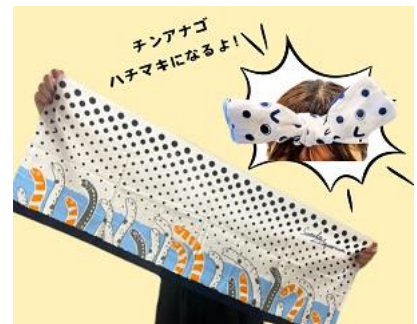
てぬぐい チンアナゴ イメージ