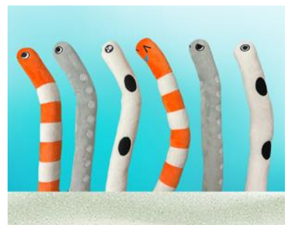
ぬいぐるみ チンアナゴ イメージ