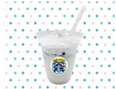
大チンアナゴ祭シェイク イメージ

お客さまご自身で混ぜるとチンアナゴのような色合いのクッキーアンドクリーム味に変わるシェイクを販売します。さらに飲んだ後のストローはチンアナゴのように変身します！