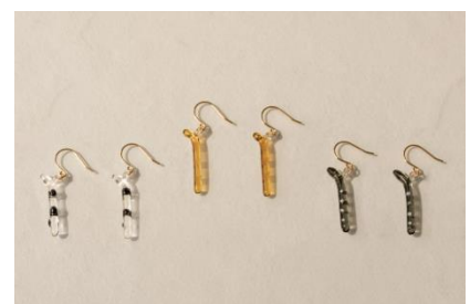
HARIO チンアナゴのガラスアクセサリー