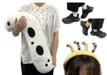
なりきり!ファッション イメージ

館内を回遊しながらお客さまをインスタントカメラで撮影するスタッフが登場します。模様や色などチンアナゴ三種に似ているファッションで来館された方を対象に、インスタントカメラで撮影した「大チンアナゴ祭」ロゴ入りの写真をその場で1枚プレゼントします。