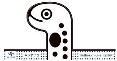
チンアナゴお面 イメージ