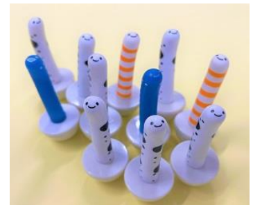
ゆらチン イメージ