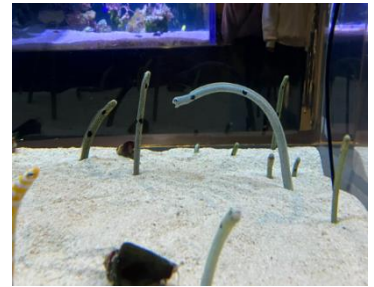
チンアナゴカメラ イメージ