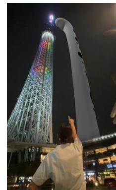
東京スカイツリーと巨大チンアナゴ イメージ

スマートフォンを東京スカイツリーにかざすと、画面上の東京スカイツリーの隣に巨大なチンアナゴが出現する仕掛けが登場します。ぜひ東京スカイツリーとチンアナゴと一緒に撮影してください。