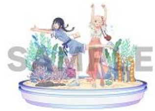
リコリス・リコイル コラボイラスト

「さかな〜」、「チンアナゴ〜」のシーンでおなじみのテレビアニメ「リコリス・リコイル」とのコラボレーションを実施します。「千東（ちさと）」がチンアナゴのポーズをとった描きおろしのイラストを使用したオリジナルグッズなどを販売します。