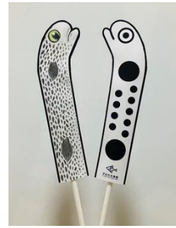
マイチンアナゴ イメージ

チンアナゴ、ニシキアナゴ、ホワイトスポットテッドガーデンイールそれぞれの特徴に注目しながら、チンアナゴ型の紙に色を塗って自分だけの「マイチンアナゴ」を作るワークショップです。完成した「マイチンアナゴ」はぜひ、館内6階に設置された三種のチンアナゴやぐらに飾ってください。