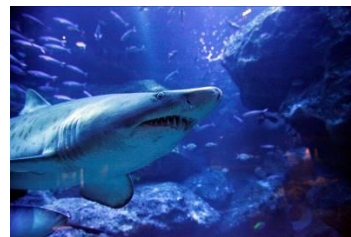
小笠原大水槽とシロワニ

「小笠原諸島」は、都心から南へ約 1,000km の太平洋上に散在する 30 余りの島々の総称です。一度も大陸と陸続きになったことがない海洋島であり、多くの固有種・希少種が生息・生育し、特異な島しょ生態系を形成しています。このことが評価され 2011 年には世界自然遺産に登録されるなど、世界的にも貴重でかけがえのない自然の宝庫です。すみだ水族館では、2012 年の開業時より、小笠原の海を再現した「小笠原大水槽」の展示や「アオウミガメの赤ちゃんの保全活動」に加え 2023 年には小笠原の情報発信拠点「オガサワラベース」を公開など、東京にある世界自然遺産の魅力を多くの方に知っていただくための活動に取り組んでいます。