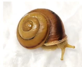
オトメカタマイマイ

※ 日本に生息または生育する野生生物について、専門家で構成される検討会が生物学的観点から個々の種の絶滅の危険度を科学的・客観的に評価し、その結果をリストにまとめたもの。