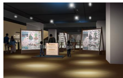
外来種除去装置が設置された入口 イメージ