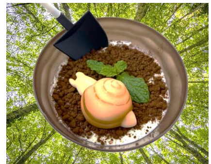
「小笠原から来た!マイマイチーズケーキ」イメージ