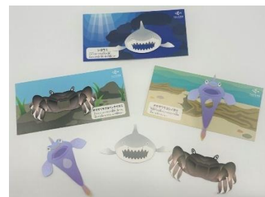
「オガサワラマーカー」イメージ

イベント期間後半にはマイマイにちなんだワークショップを開催予定です。2種類のワークショップをぜひお楽しみください。