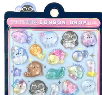
オリジナル BONBON ドロップシール イメージ