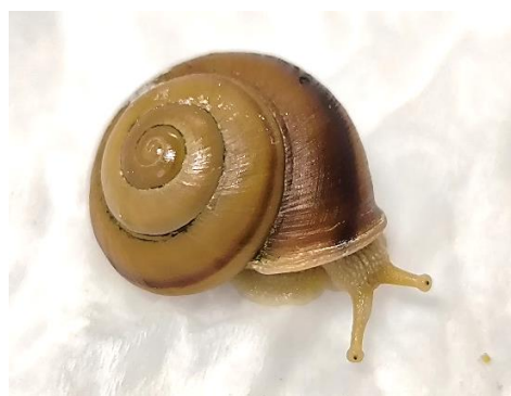
オトメカタマイマイ

「すみだボニンアイランド」は昨年初開催しご好評いただいたイベントです。東京都でありながら、都心から約 1,000km 離れた島「小笠原諸島（別名：ボニンアイランド）、以下『小笠原』」の魅力を、さまざまな視点から体験いただけるイベントです。すみだ水族館では 2012 年の開業以来、小笠原の海を再現した「小笠原大水槽」の展示を通じて、島の豊かな生態系を紹介してまいりました。また、2023 年に開設した小笠原の情報発信拠点である常設展示エリア「オガサワラベース※」では、東京に存在する世界自然遺産の魅力を、より多くの方に伝える取り組みを続けています。