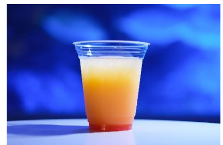
「コペペサンセット」イメージ