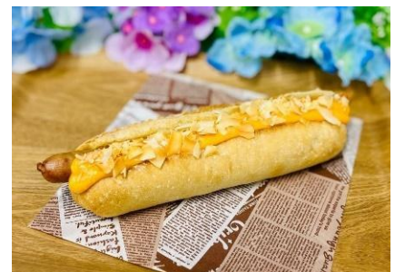
「アイランドチーズドッグ」イメージ