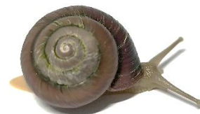
コガネカタマイマイ