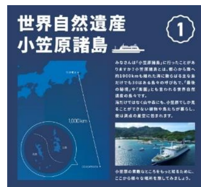
展示パネルイメージ

また、小笠原は大陸と陸続きになったことがなく、島にいきものたちがたどり着くには広い海を渡る必要があります。そのために必要な要素を3W（Wind：風、Wing：翼、Wave：波）と呼んでいます。この3つのWがどのようにいきものたちを運んできたのかをパネルで解説します。小笠原の香りや音が出る仕掛け付きで、まるで小笠原を訪れたかのような体験をお楽しみいただけます。